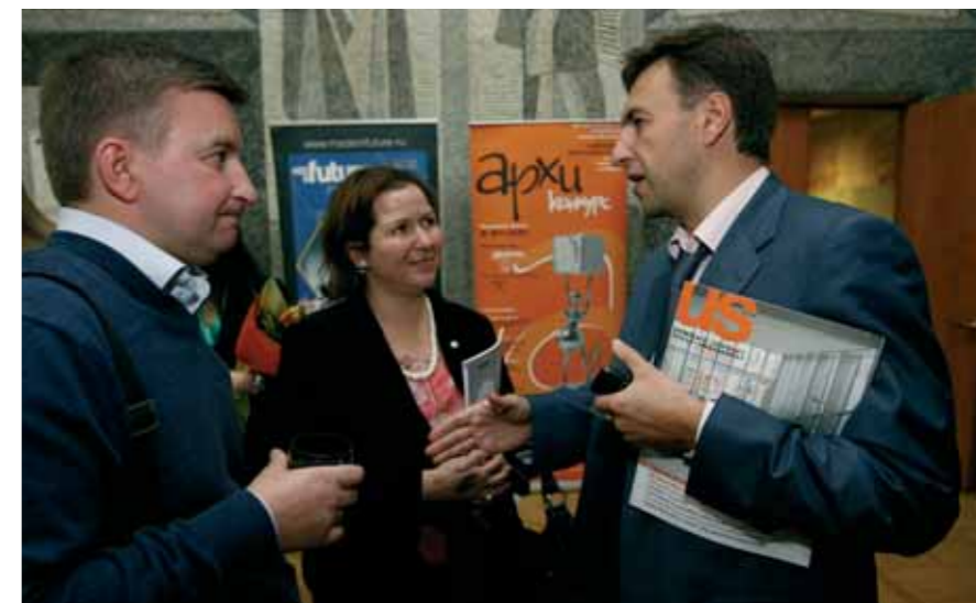
Церемония награждения победителей «Архиконкурса»